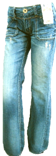
ヒッピーフレアー