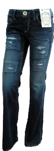
マニッシュフレアー

注目度急上昇中のフレアーシルエット。マニッシュフレアー、ベルフレアー、ヒッピーフレアー、クールフレアーの4種類。