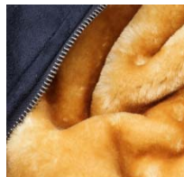
毛皮のようなボリュームのあるフェイクファーを使用