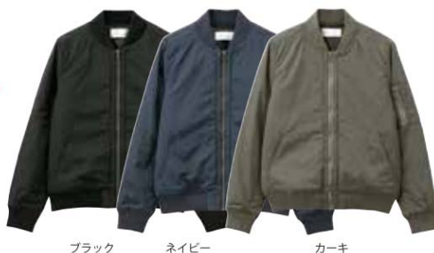
ブラック ネイビー カーキ