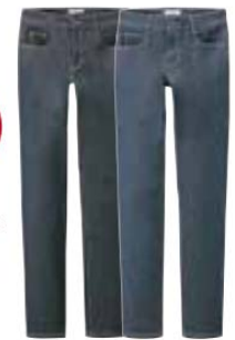
ワンウォッシュ ユーズド