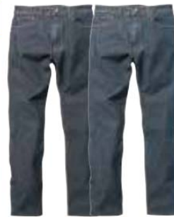
ワンウォッシュ ユーズド