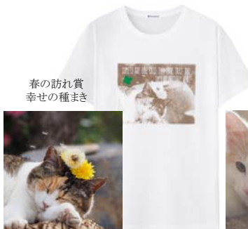
春の訪れ賞 幸せの種まき