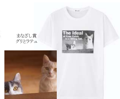
まなざし賞 グリとラテュ