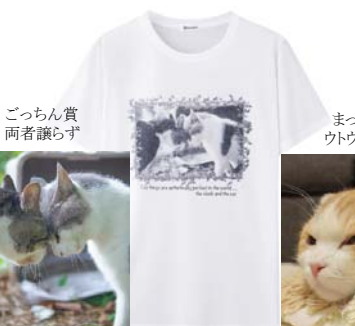
ごっちゃん賞 両者譲らず