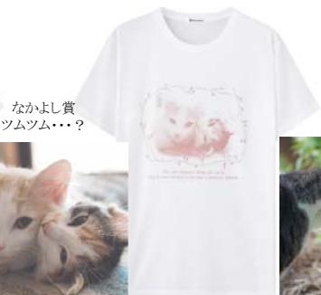
なかよし賞 ツムツム...?