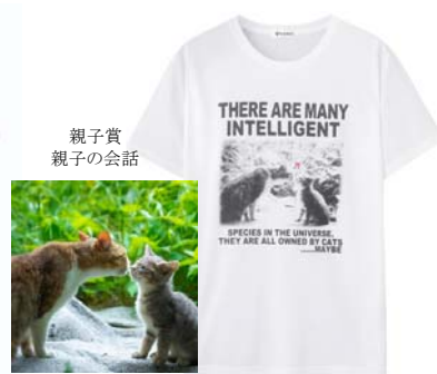
親子賞 親子の会話