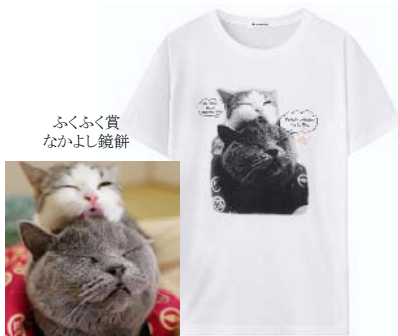
ふくふく賞 なかよし鏡餅