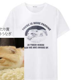
まったり賞 ウトウトうなぎ