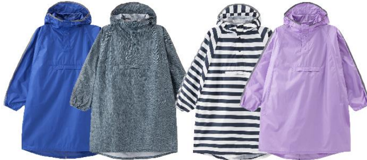
(サイズ:長さ約85cm、幅約149cm)