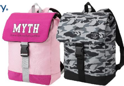
(サイズ:縦約36cm、横約27cm、奥行約13cm)