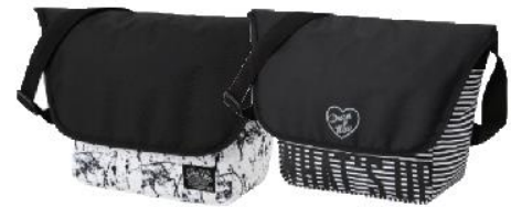
(サイズ:縦約25cm、横約25cm、奥行約12cm)

●販売店舗:マックハウス、マックハウス スーパーストア、マックハウス スーパーストアフューチャーなど、全国約426店舗 及び当社ECサイト( https://store.mac-house.co.jp ) ※一部、取り扱いのない店舗がございます。