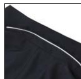
襟の裏側がリフレクターのバイピング使用。