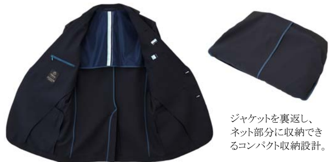
ジャケットを裏返し、ネット部分に収納できるコンパクト収納設計。