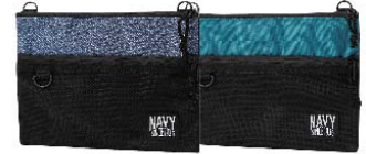
ネイビー ターコイズ