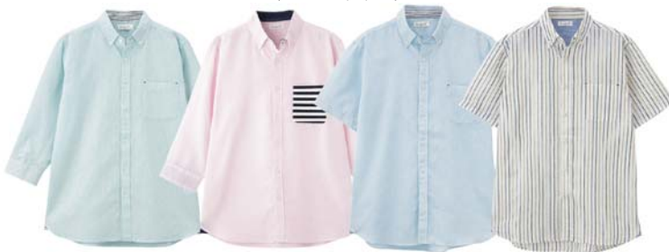
グリーン ピンク サックス ホワイトストライプ