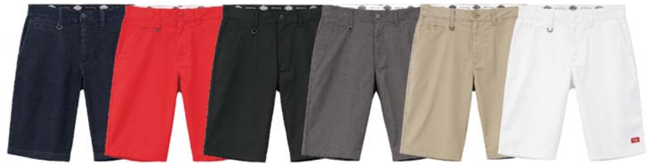
SW レッド ブラック グレー ページュ ホワイト