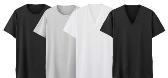
ブラック グレー ホワイト ブラック