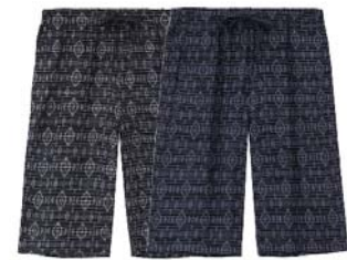
ブラックネイティブ柄 ネイビーネイティブ柄