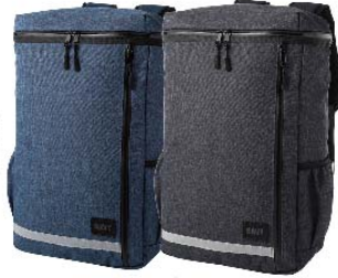
ネイビー ブラック