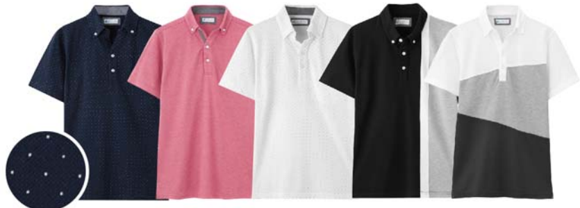
ネイビードット ピンク ホワイトドット ブラック×グレー ホワイト×グレー