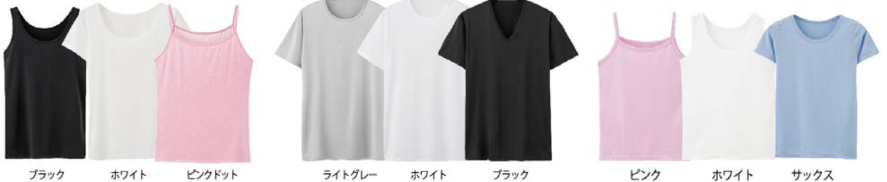
ブラック ホワイト ピンクドット ライトグレー ホワイト ブラック ピンク ホワイト サックス