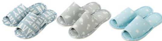
ロゴ柄 動物柄 猫柄