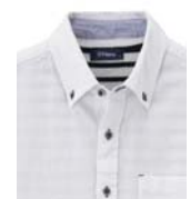
襟裏に別生地、ボタンホール・ポケットカン止めを配色でアクセント