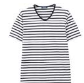
クルーのTシャツがセットになっています