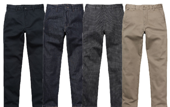
ネイビー ワンウォッシュ グレンチェック ベージュ