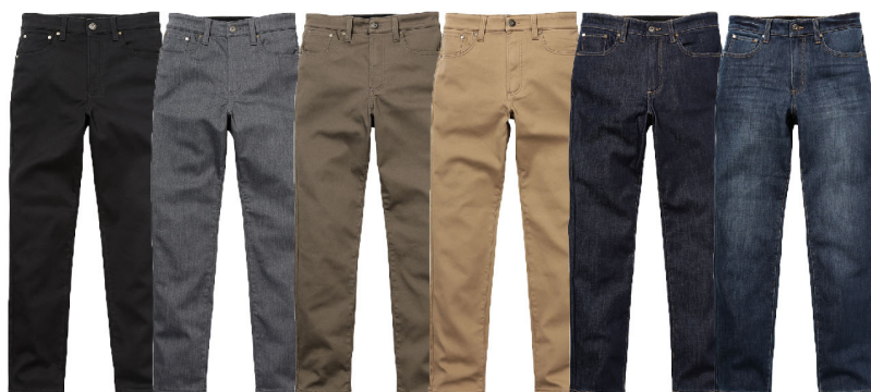
クロ グレー グレージュ ライトベージュ ワンウォッシュ 中濃