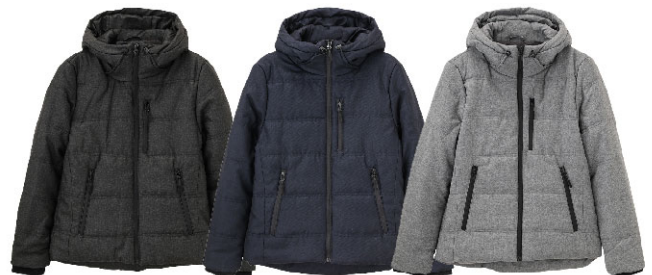
クロ ネイビー グレー