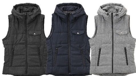
クロ ネイビー グレー