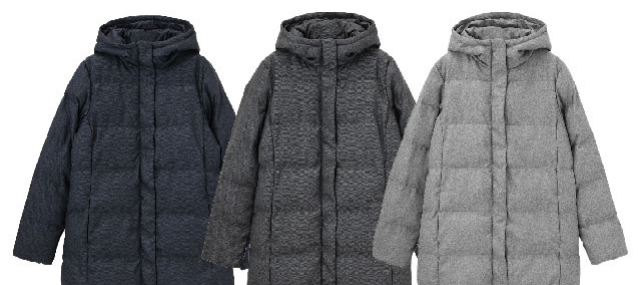
ネイビー ダークグレー グレー