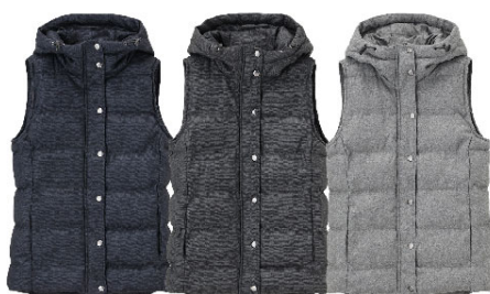
ネイビー ダークグレー グレー