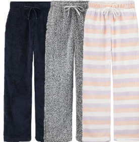
ネイビー グレー ピンク