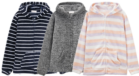
ネイビー グレー ピンク