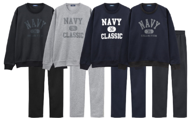
チャコールグレー