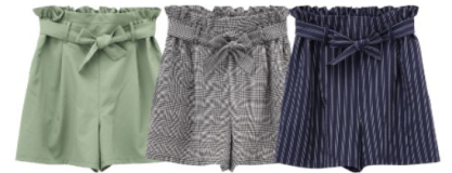
●ウェストリボンキュロット 1,990円+税(サイズ:120cm~160cm)