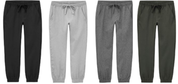
●イージージョガーパンツ 1,990円+税(サイズ:S/M/L/XL)