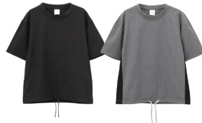
●脇切り替えTシャツ 1,490円+税(サイズ:120cm~150cm)