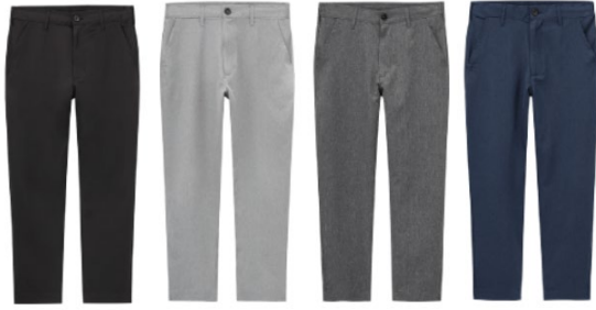
●イージーアンクルパンツ 1,990円+税(サイズ:S/M/L/XL)