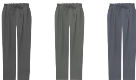
●イージーテーパードパンツ 1,990円+税(サイズS/M/L)