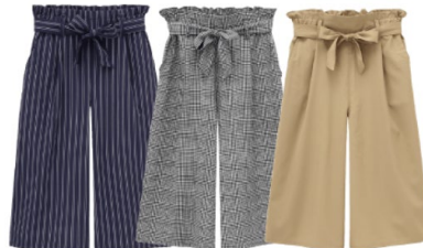
●ウェストリボンガウチョ 1,990円+税(サイズ:120cm~160cm)