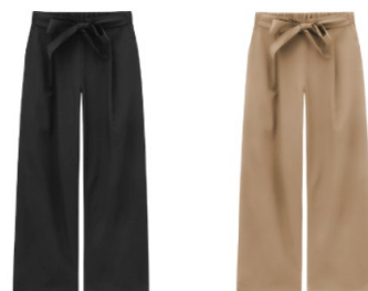
●サッシュベルト付きワイドパンツ 1,990円+税(サイズS/M/L)