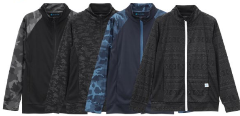
●SAUPF50+ZIPスタンドジャケット 1,990円+税(サイズ:S/M/L)