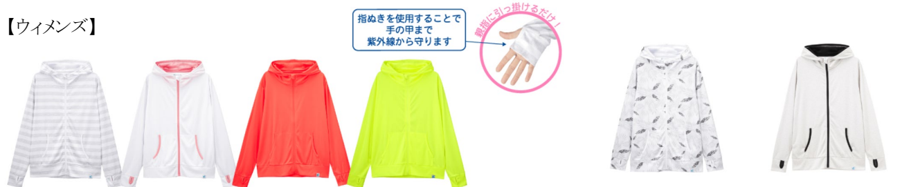
●SAUPF50+ZIPパーカ(ラッシュガード) 2,990円+税(サイズ:M/L)※6月発売予定