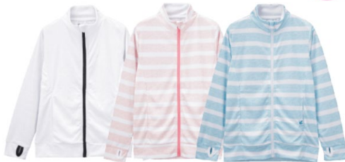
●ガールズUPF50+ZIPスタンドジャケット 1,990円+税(サイズ:S/M/L)