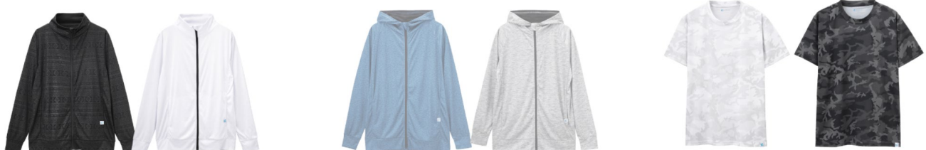
●SAUPF50+ZIPスタンドジャケット 2,990円+税(サイズ:M/L/XL)